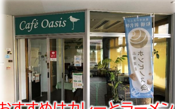
おすすめはカレーとラーメン！

自然観察センターに入ると、入口右手には「売店」、左奥にはカフェ「Café Oasis（カフェオアシス）」があります。