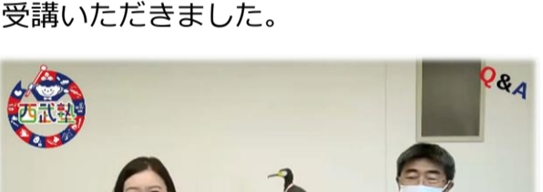
会場での配信の様子

会場カメラを設置し、当日視聴可能な塾生の皆さんとオンラインツールを使ってコミュニケーションを取りました。また、投票機能を使ったクイズなども実施し、干潟からの中継（LIVE配信）を行いました。参加された塾生の皆さんは、オンラインツールの操作に慣れている様子で楽しく受講いただきました。