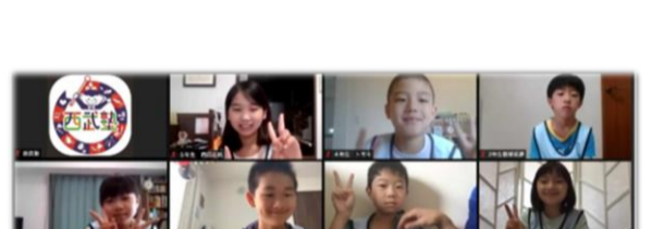
オンライン配信の様子