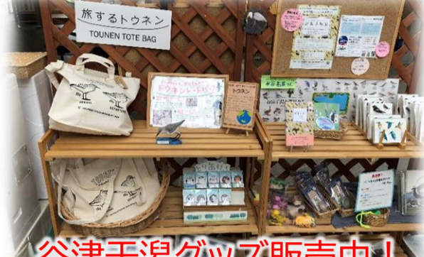
谷津干潟グッズ販売中！