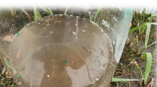
マイクロプラスチック